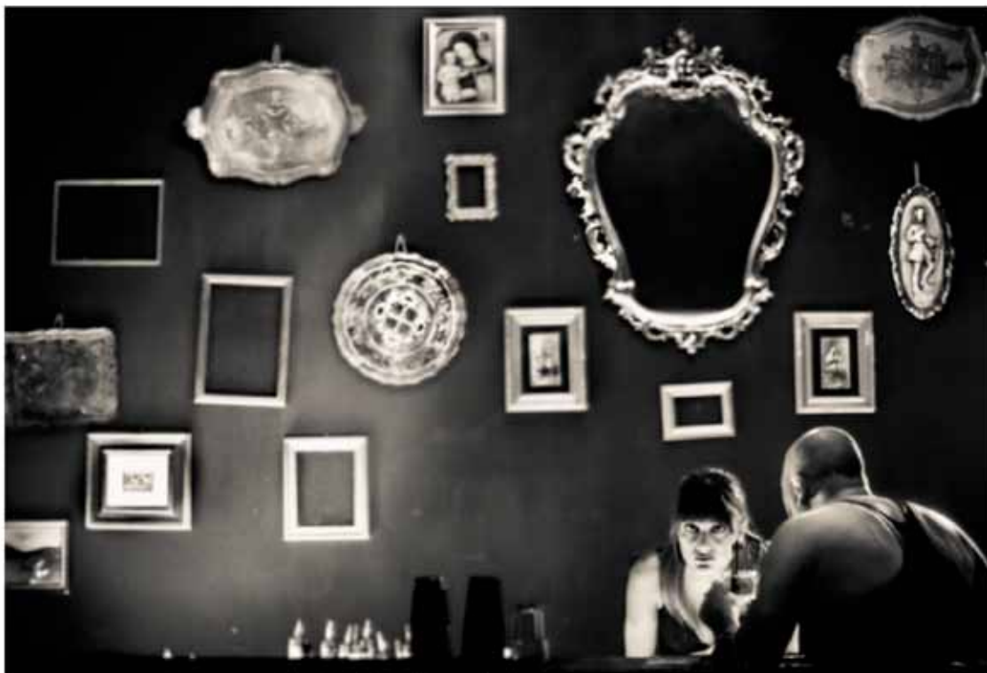
BDSM Tecniche di Consolazione

Fotografo, regista, ma anche giornalista e attore, Francesco Cabras è in queste settimane protagonista con due mostre personali estremamente diverse tra loro: a Torino, Urban Icons, the Democracy of The Wall (fino al 27 novembre) e Scraps. Quello che resta (fino al 29 dicembre) presso la Galleria Raffaella De Chirico di arte contemporanea; e, a Milano, BDSM, Tecniche di Consolazione a cura di Raffaella De Chirico e Omero Udovich (fino al 22 dicembre presso De Chirico and Udovich Con-Temporary). A Sguardi racconta i suoi progetti, le sue tecniche, la sua ricerca.