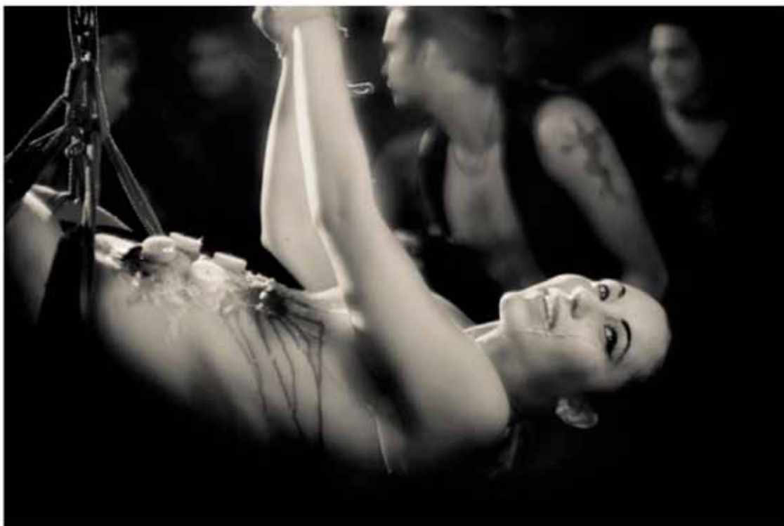
BDSM Tecniche di Consolazione