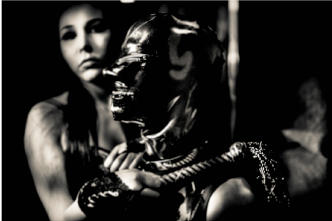
BDSM Tecniche di Consolazione

Ho usato ottiche fisse ultraluminose , da 14mm a un 50mm 1:0, variando tra Leica, Nikon e Canon. Niente flash, niente cavalletto, volevo una temperatura emotiva leggermente fantasmatica soprattutto fotografando chi era seminudo o, al contrario, molto stagliata e contrastata per i dettagli del corpo o sui primi piani. È stato un lavoro durato mesi e ogni sessione durava circa sei sette ore, quanto le riunioni. Il processo di post produzione è stato infinito, non perché abbia fatto chissà cosa ma per ottenere il tipo di bianco e nero che mi soddisfacesse avendo scattato in digitale. È stato molto difficile per me, non essendo un vero post produttore, ma alla fine esaltante . Riuscire ad applicare l'esperienza in camera oscura sugli strumenti digitali è meraviglioso, senza nulla togliere alla bellezza della precedente tecnologia . Non mi capita praticamente mai, ma quando ho visto le stampe di grande formato mi sono emozionato , mi piacevano realmente. Ho capito di aver aggiunto un piccolo tassello. Grazie anche a Davide Di Gianni e al suo laboratorio di stampa , non è pubblicità, trovo sgradevole che generalmente non si dia un'informazione possibilmente precisa sui contributi più importanti di un lavoro.